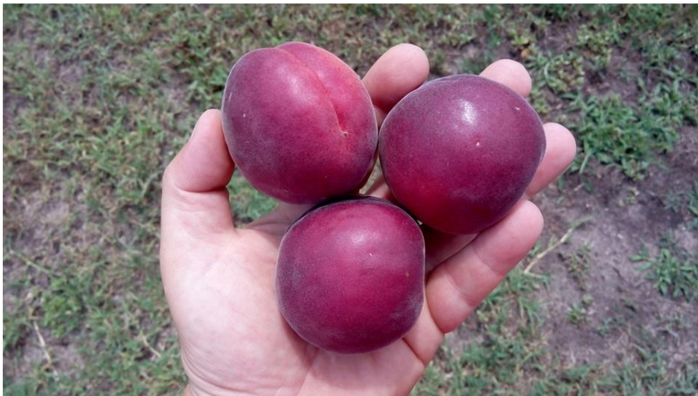
Rougecot R

Rougecot R (N o 2011-72 (COV)) Nemesítő: COT International, Franciaország