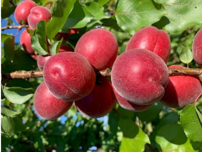
Rubista Carmingo ®

Gyümölcs szaporítóanyag nagykereskedelmi eng. szám: 78/2005 Növény egészségügyi reg. szám: HU 1321406174