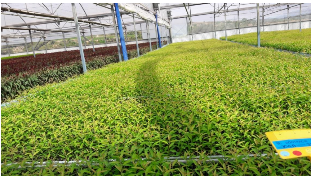
Rootpac R R merisztéma alany (Agromillora Iberia, Spanyolország, 2017.06.26)

Mirobalán szilva és mandula hibrid, az Agromillora cég alany nemesítési programjából. Növekedési erélye erős. Jó a kompatibilitása a szilva, őszibarack és nektarin fajtákkal, de megfelelő lehet néhány mandula és kajsziarack fajtához is. A rá oltott fák bő termők lesznek, fajtától függően 2-5 nappal korábban érhetnek, mint a hagyományos alanyokon. A gyümölcsméret kiváló a Rootpac R R alanyú fákban. Nagyon jól adaptálódik különböző klimatikus viszonyokhoz, az újra ültetést is nagyszerűen tűri. Szilárd szövetű, felálló növekedésű alanyok, faiskolai termesztésben is kiválóak. A hideget is jól tűrik, klorózis toleranciájuk megfelelő. Gyökérgolyva érzékenysége még nem ismert, de a kórokozó talajgombáknak általában ellenáll.