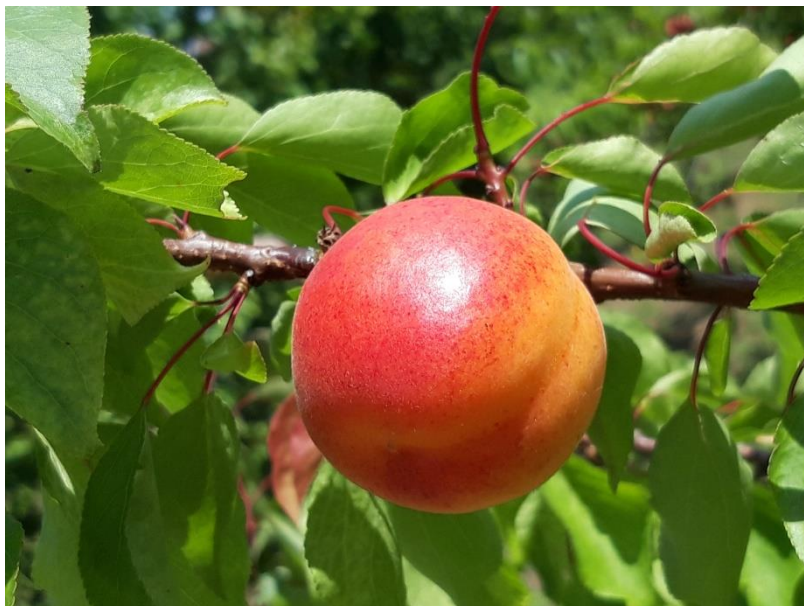
Tsunami R

Gyümölcs szaporítóanyag nagykereskedelmi eng. szám: 78/2005 Növény egészségügyi reg. szám: HU 1321406174