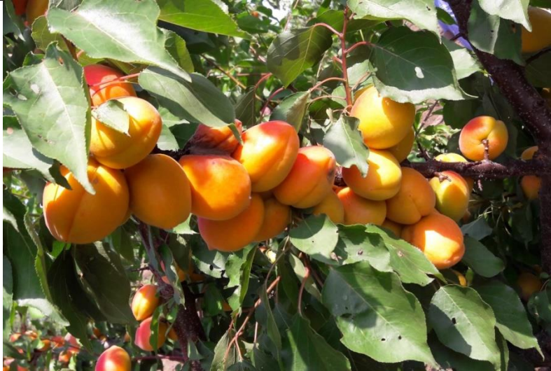
Faralia Carmingo ® – IPS 1285 – COV

Gyümölcs szaporítóanyag nagykereskedelmi eng. szám: 78/2005 Növény egészségügyi reg. szám: HU 1321406174