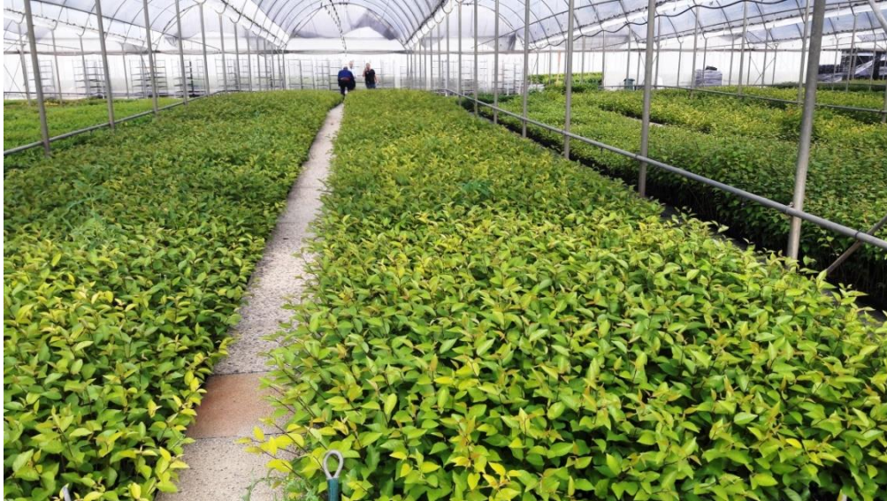
Merisztéma szaporított Myrobalan 29C állomány