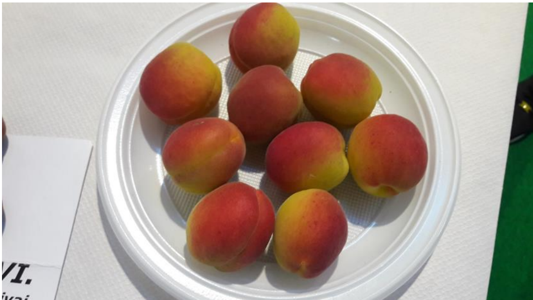
Mikado ® - cov, öntermékeny, extra korai kajszi

Nemesítője a PSB Produccion Vegetal (E). Nagyon erős növekedésű, félig nyitott korona habitusú fajta. Korán virágzik (nálunk nem előny!), öntermékeny. Érés ideje a Pinkcot ® előtt 20 nappal (extra korai), előzi a Tsunami ® és Pricia ® fajtákat is. Mérete 2A, világos piros fedőszín borítja a fényes narancsos alapszínt. Kissé hosszúkás gömb alakú. Nagyon jó ízű, kiegyenlített sav- cukor aránnyal, kemény húsállománnyal.