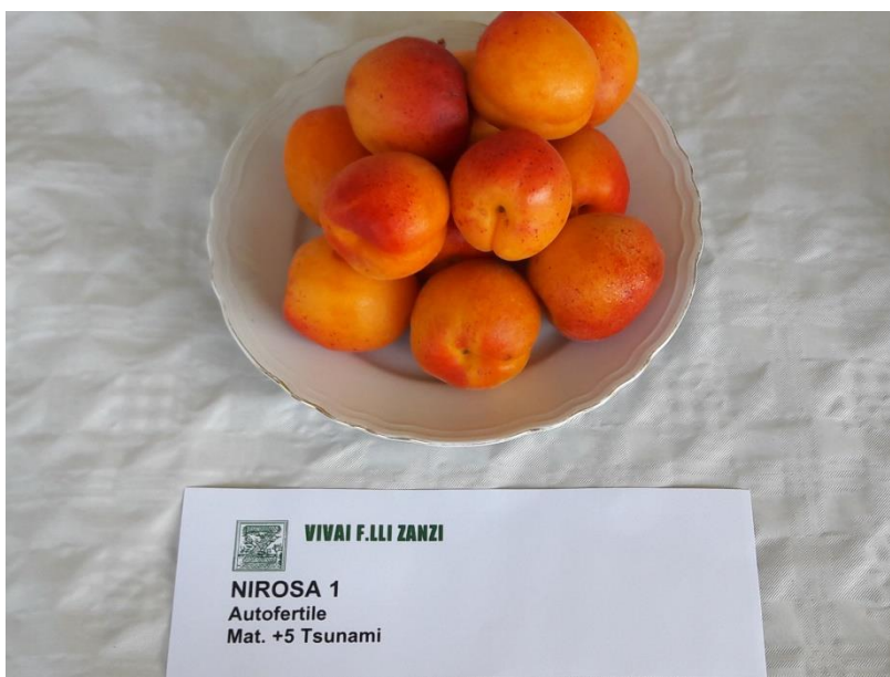
Nirosa 1 R